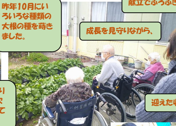
成長を見守りながら、