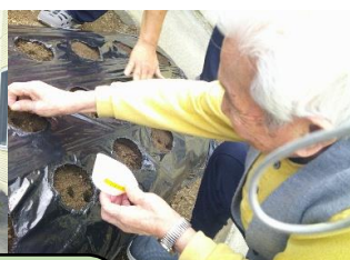
昨年10月にいろいろな種類の大根の種を蒔きました。