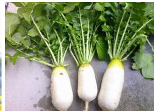
献立でふろふき大根として登場しました。