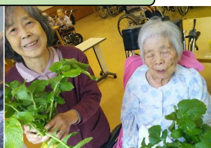
迎えた収穫の時期。