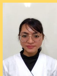
調理 スウェイカイン